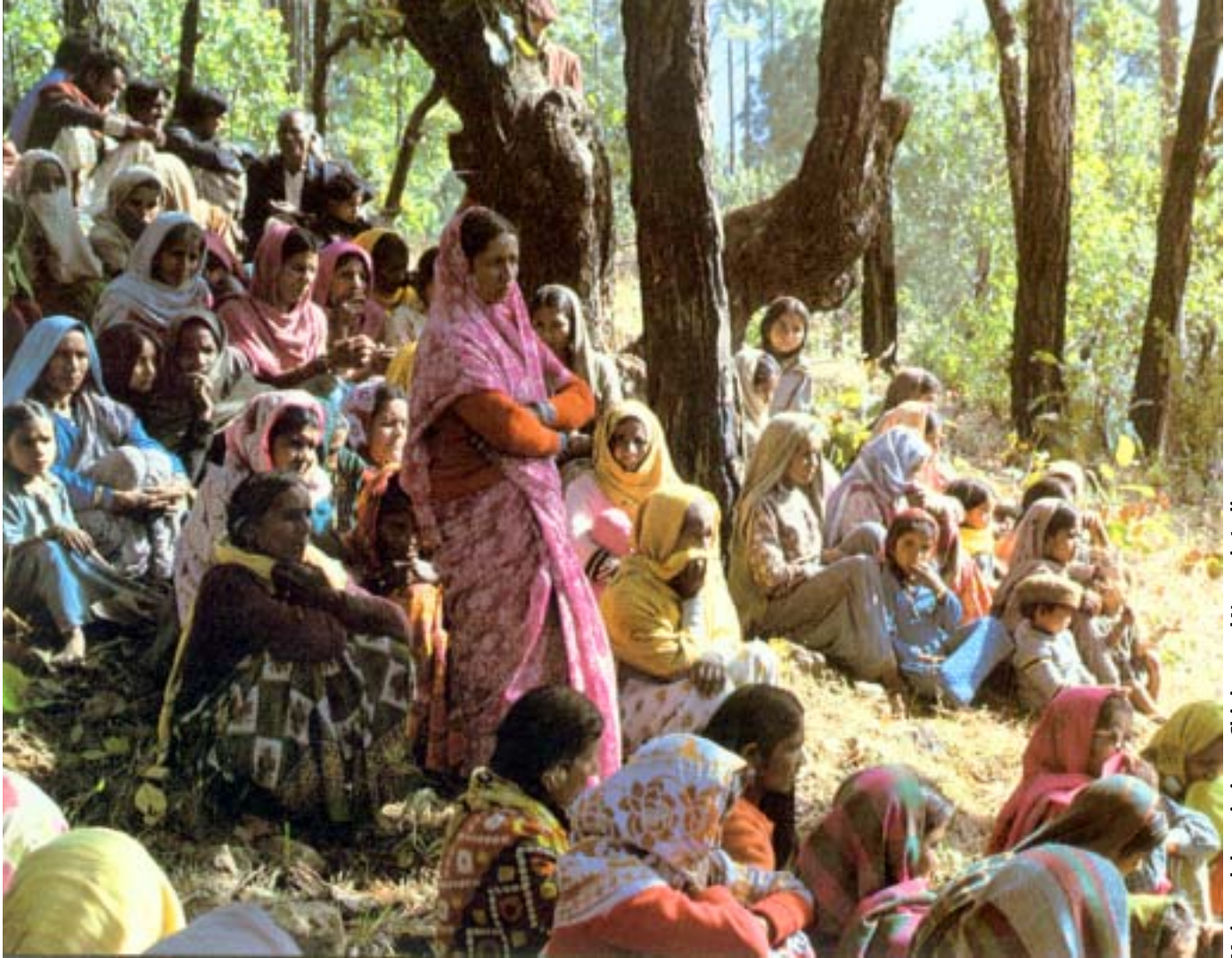
Mujeres del movimiento Chipko, en el Norte de India.