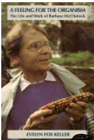
Evelyn Fox Keller

El ambientalismo feminista de Bina Agarwal es una buena muestra de la posición constructivista. Economista de formación, originaria de la India como Vandana Shiva, critica la teoría de ésta que atribuye la actividad protectora de la Naturaleza de las mujeres de su país al principio femenino de su cosmología. Para Agarwal, el lazo que ciertas mujeres sienten con la Naturaleza tiene su origen en sus responsabilidades de género en la economía familiar. Piensan holísticamente y en términos de interacción y prioridad comunitaria por la realidad material en la que se hallan. No son las características afectivas o cognitivas propias de su sexo sino su interacción con el medio ambiente (cuidado del huerto, recogida de leña) lo que favorece su conciencia ecológica. La interacción con el medio ambiente y la correspondiente sensibilidad o falta de sensibilidad ecologista generada por ésta dependen de la división sexual del trabajo y de la distribución del poder y de la propiedad según las divisiones de clase, género, raza y casta.