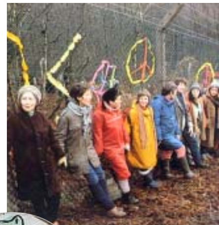
Mujeres en Greenham Common